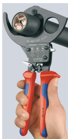
Ratelprincipe en tandkransaandrijving met twee gangen om te snijden met minder kracht