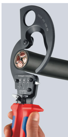
95 31 280: Grote capaciteit: max. Ø 52 mm / 380 mm 2